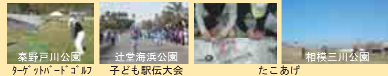
秦野戸川公園 ターゲットバードゴルフ

15日：秦野戸川公園 農体験じゃがいもづくり★ 15日：三ツ池公園 環境探偵団(竹の観察と工作) 23日：茅ヶ崎里山公園 春の谷戸観察会★